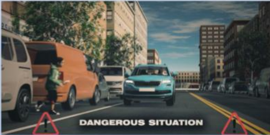
Crossing into oncoming traffic