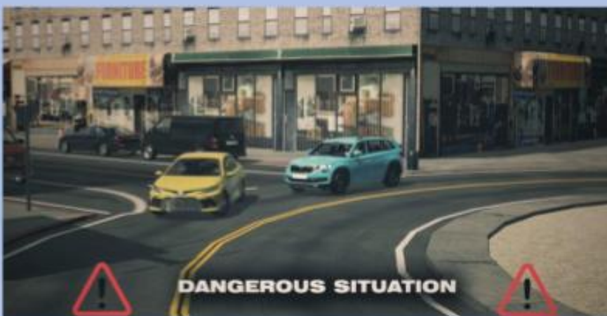
Merging without yielding